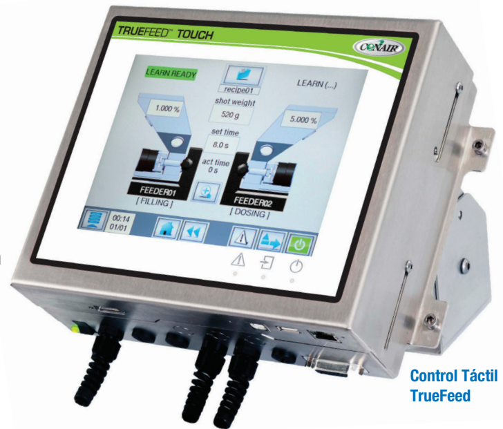
Control Táctil TrueFeed

El control de pantalla táctil de 8 pulgadas está disponible para todos los alimentadores gravimétricos TrueFeed de Conair, lo que permite una operación muy simple de sistemas de uno o varios componentes.